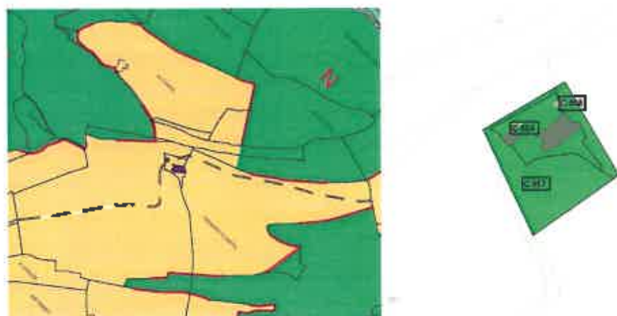
PLU de Montlebon – Zonage et parcellaire de la ferme de Derrière-le-Château, repérable comme pouvant changer de destinations

Cette modification n'impacte nullement le PADD, ni le zonage d'urbanisme et le règlement applicable, et permet la préservation d'un élément patrimonial de la commune.