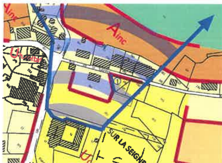
Réduction de l'ER n°1 – Extrait du PLU après modification

La majorité de ces parcelles étant devenues propriété municipale, en direct ou par portage par l'Etablissement Public Foncier Doubs-BFC, depuis l'adoption du PLU, seule une bande de terrain reste aujourd'hui propriété privée. Il n'y a donc pas d'intérêt de conserver cet emplacement réservé dans sa totalité, et il est proposé de le réduire à la seule parcelle cadastrée AB 212, selon le plan ci-dessous :