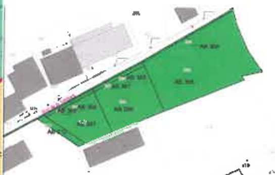
Parcelles concernées par l'ER n°1

La majorité de ces parcelles étant devenues propriété municipale, en direct ou par portage par l'Etablissement Public Foncier Doubs-BFC, depuis l'adoption du PLU, seule une bande de terrain reste aujourd'hui propriété privée. Il n'y a donc pas d'intérêt de conserver cet emplacement réservé dans sa totalité, et il est proposé de le réduire à la seule parcelle cadastrée AB 212, selon le plan ci-dessous :