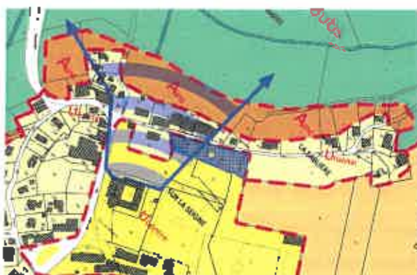
Extrait du PLU avant modification – ER n°1

Dans le PLU adopté en mars 2019 par la commune de Montlebon, un emplacement réservé n° 1 (ER n°1) était inscrit rue de la Sablière, sur les parcelles cadastrées AB 212, AB 365, AB 366, AB 367, AB 368, AB 386, AB 387, AB 388, et AB 389, soit environ 3 300 m 2 , dans le cadre d'un projet d'aménagement par la commune.