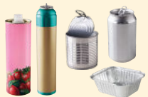
Bouteilles • Aérosols alimentaires / d'hygiène • Conserves • Canettes