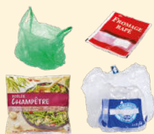
Sacs, sachets, films