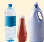
Bouteilles & flacons