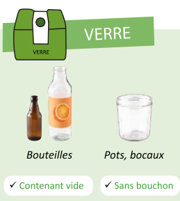
Bouteilles Pots, bocaux