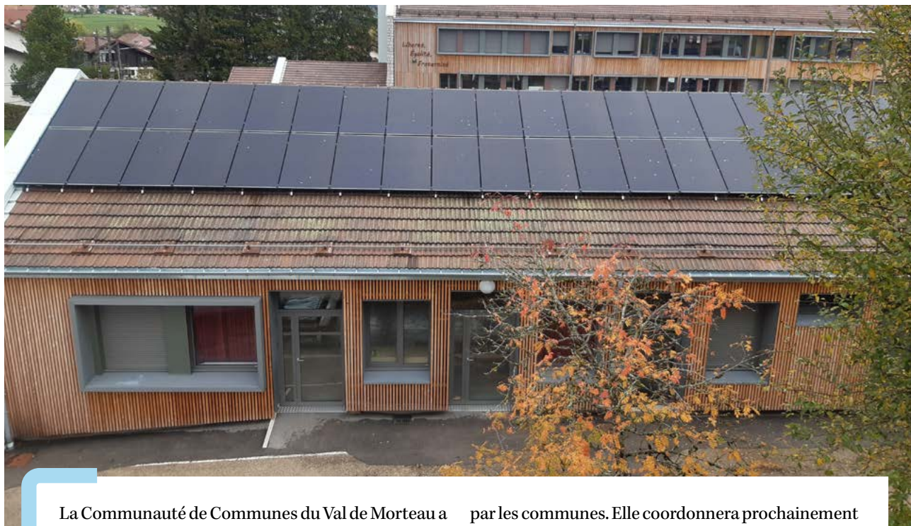
Schéma Directeur des énergies et projet de solarisation des bâtiments publics

La Communauté de Communes du Val de Morteau a initié l'élaboration du schéma directeur des énergies et des réseaux de chaleur. Il doit permettre la définition d'un plan d'actions très opérationnel.